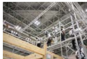
※画像は2025年開催時のものです。